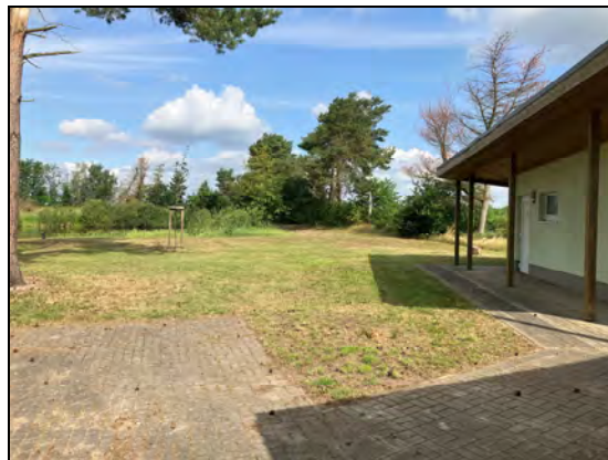
Blick zur Badekuhle

Der Bereich der Badekuhle wird durch das Gewässer geprägt. Nordwestlich des Gewässers ist ein Wall vorhanden, der offensichtlich aus Aufschüttungen der Gewässerentschlammung stammt.