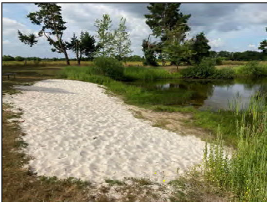
Strand an der Badekuhle

Der Änderungsbereich wird durch eine Vielzahl von Biotoptypen geprägt, die eine unterschiedliche Bedeutung für den Naturhaushalt haben. Am Rand des Gebietes wird die Fläche gegenüber den angrenzenden Ackerflächen durch teilweise lückige Baumreihen und Gehölzbereiche eingegrünt. Sie bestehen überwiegend aus Birken und Kiefern, teilweise mit Weiden und Eichen durchsetzt. Aufgrund der mehrjährigen trockenen Witterungsbedingungen ist der Grundwasserspiegel der grundwasserbestimmenden Böden stark gesunken, wodurch Teile des Baumbestandes abgestorben sind. Dies betrifft insbesondere höherwertige Gehölzarten und Birken, während die Kiefern noch vital sind. Das Gebiet wird durch Gehölzbereiche in vier Abschnitte gegliedert, die Flächen der Stellplätze unmittelbar an der Straße, der sich daran anschließende Scherrasenbereich, der Fußballplatz und der Spielplatz sowie der Badebereich mit der Badekuhle.