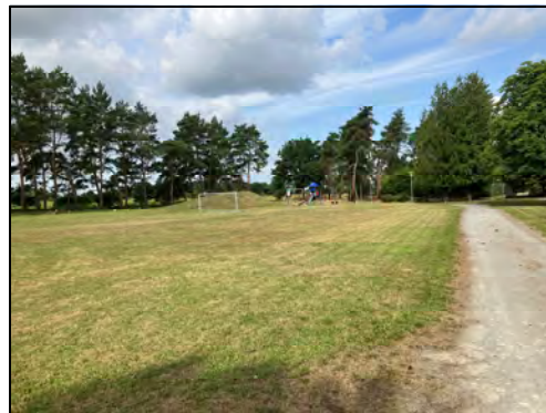
Fußball- und Spielplatz mit Rodelberg

Der mittlere Teil des Änderungsbereiches wird intensiv als Sport- und Spielplatz genutzt. Auf dem Gelände ist eine Aufschüttung aus der Entschlammung der Badekuhle vorhanden, die als Rodelberg genutzt wird.